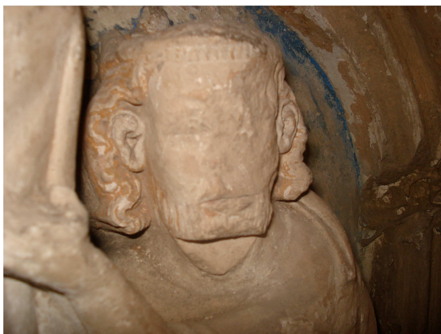
Túmulo do rei D. Dinis. Igreja de S. Dinis, Odivelas. Pormenor