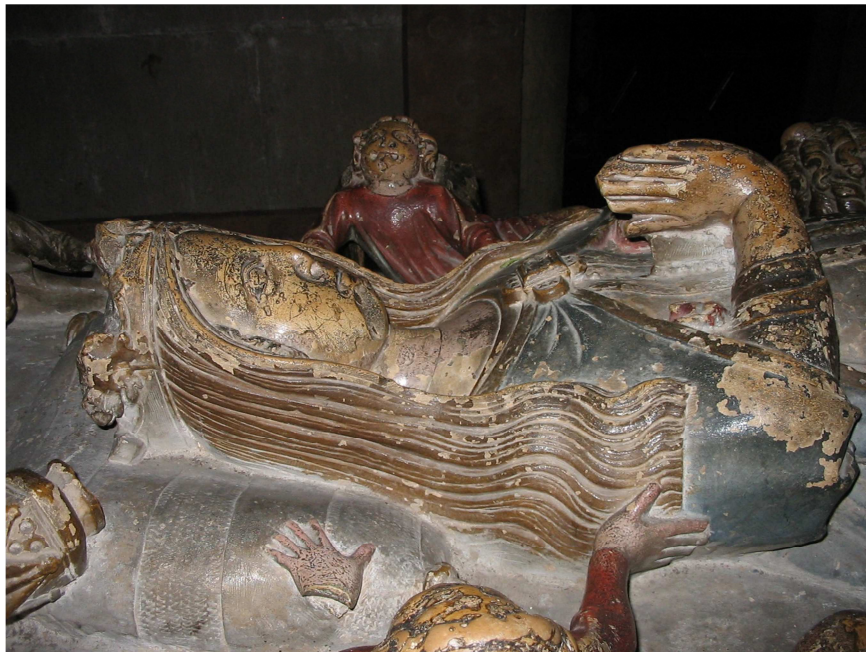
Túmulo da infanta D. Isabel. Mosteiro de S. Clara-a-Nova, Coimbra.